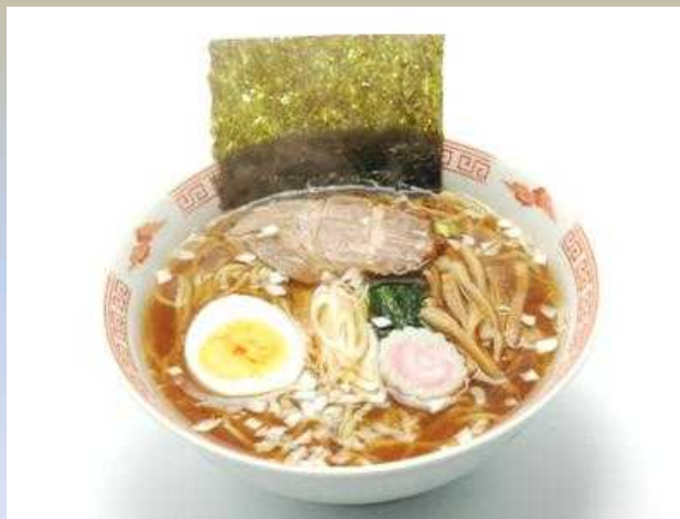
東京醤油ラーメン