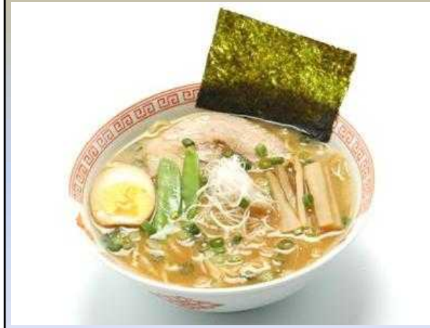
横浜醤油ラーメン