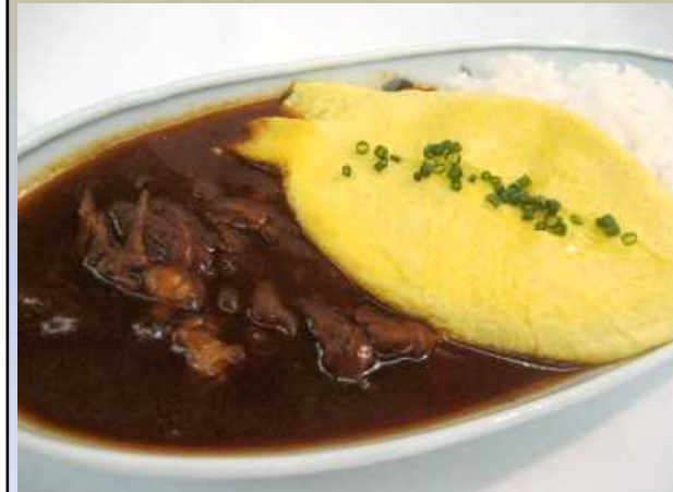
とろとろオムレツのハヤシライス

牛すじとニンジン、玉ねぎ、セロリなどをじっくり煮込んだフォンデュソースから仕上げたコクのあるデミグラスソースです。