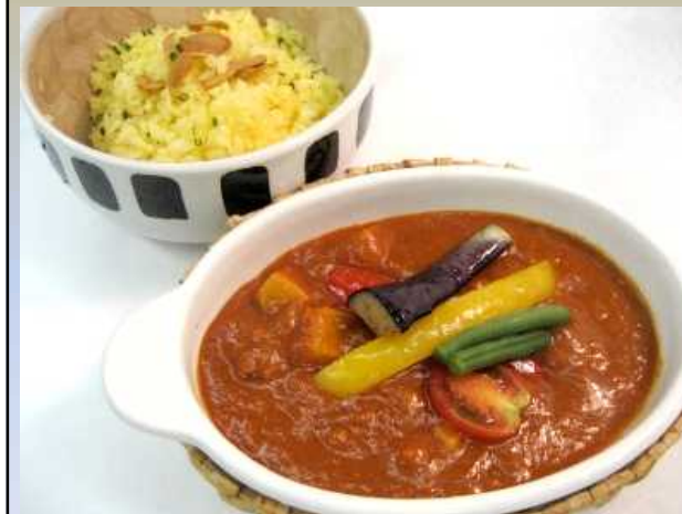
イタリアントマトカレー

炊いたライスに混ぜるだけで、簡単にサフランライスが作れるすぐれ物！！もちろん、通常のカレーにもご使用になれます。