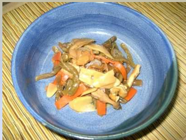
国産みずの油いため煮