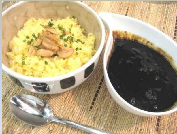
魔訶カレー Specialサフランライス添え

暖めても半熟状態で、切れ目を入れると中からとろり半熟状の中身が流れ出てきます。ソフトな食感で口どけのよいジューシーなオムレツです。