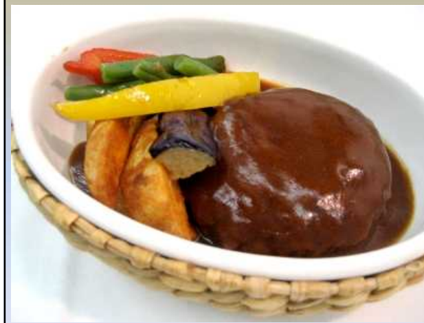
デミグラスソースの煮込みハンバーグ